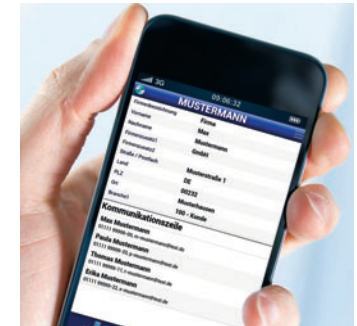
Adressdaten können übers Web auf dem Smartphone angezeigt werden.

liebig viele Kostensatz-Varianten zurückgreifen. Völlig neu ist die Ressourcenplanung zur Steuerung von Mitarbeitern, Kostenstellen, Maschinen und Fahrzeugen, die noch in diesem Jahr zur Verfügung stehen wird. (ra)